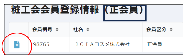
図5 粧工学会員登録情報(入口)

7. 登録情報が表示されますので、画面右上のペンマークのアイコンをクリックすると、登録情報の編集画面に移行しますので、情報を編集してください。(変更依頼の方法も同様です。)