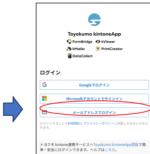
図1 粧工会会員登録情報認証画面