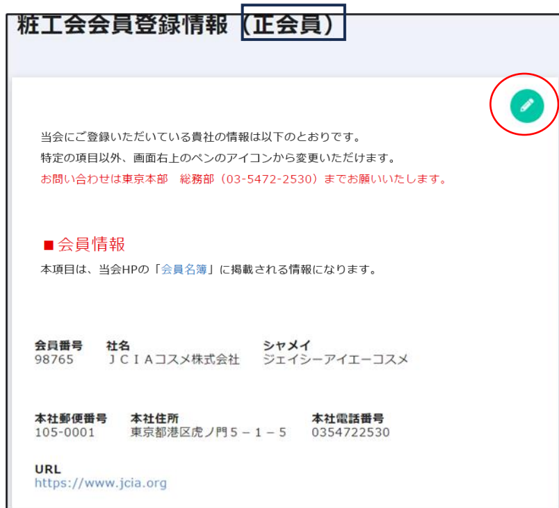
図6 粧工会会員登録情報ページの編集アイコン ※ 実際の画面のレイアウトと異なる場合があります。