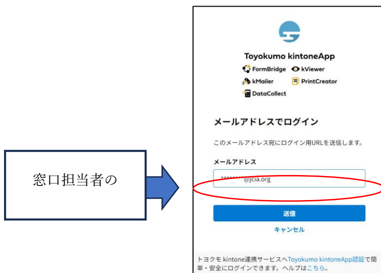
図2 粧工会会員登録情報認証画面(メールアドレスの入力)