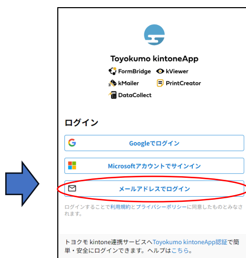
図 1 日本化粧品工業会 総会・懇親会出欠認証画面

② 図 2 の画面が表示されたら、 会員代表者連絡担当者のメールアドレス※ を入力し、送信ボタンをクリック。