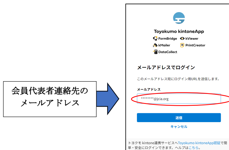
図 2 日本化粧品工業会 総会・懇親会出欠認証（メールアドレスの入力）