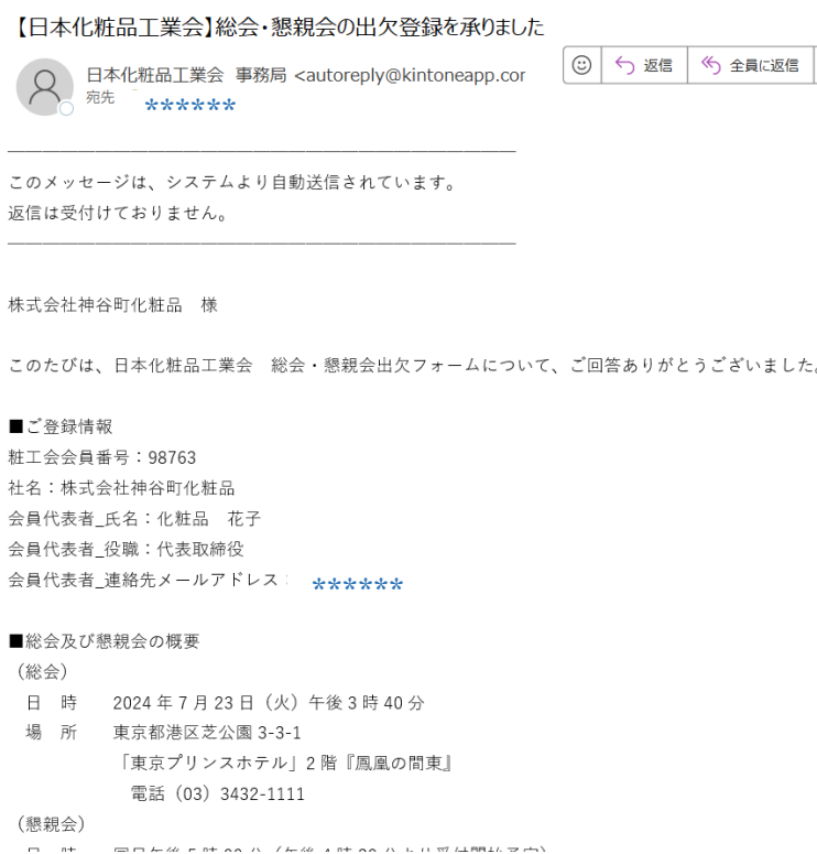
図8 日本化粧品工業会 総会・懇親会出欠登録後の自動返信メール