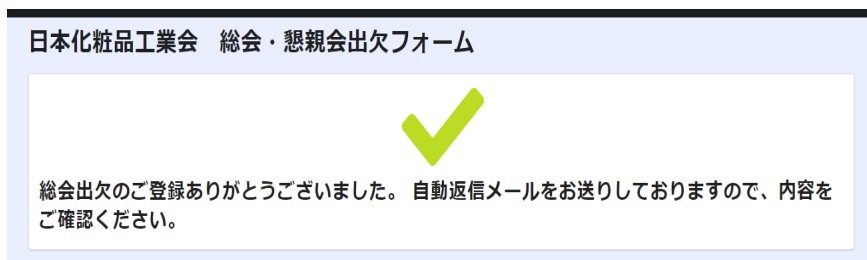
図7 日本化粧品工業会 総会・懇親会出欠ページの登録完了画面