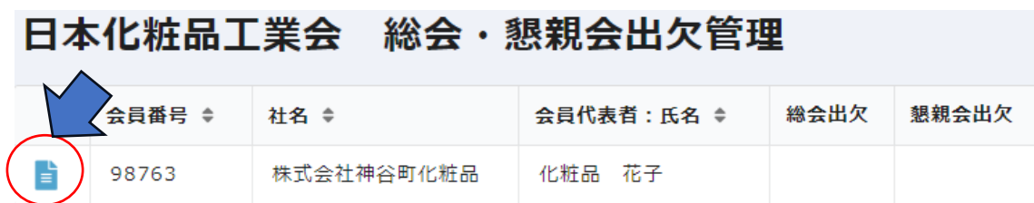
図4 日本化粧品工業会 総会・懇親会出欠（入口）